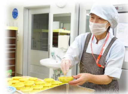
トレーに並べたりするお仕事です