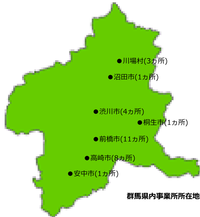
群馬県内事業所所在地

グループ施設での勤務が多いため、長期間安定して働くことができ、着実にステップアップできます。また、群馬県内で地元密着で事業展開していますので県外等への転勤もなく、自宅から通勤できるので安心です。